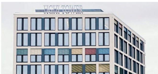
HGHI Tower, CLP Büro Berlin

Als mitgeschäftsführender Gesellschafter der CLP Akademie referiert er bundesweit sowohl inhouse für die CLP Akademie als auch für diverse kommunale Studieninstitute. Mit seinem Zertifizierungslehrgang zum Vergabemanager/-in hat er in mehreren Bundesländern den deutschlandweit ersten Grundstein für eine umfassende vergaberechtliche Ausbildung gelegt. Er publiziert außerdem regelmäßig zu vergaberechtlichen Themen. Darüber hinaus ist er als Berater im Rahmen der Implementierung von Compliance-Management-Systemen tätig. (*Risikomanagement-Beauftragter entsprechend den Anforderungen der ONR 49003)